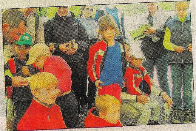
Le jeune public s'est passionné à l'écologie au travers des animations proposées en parallèle de la course.